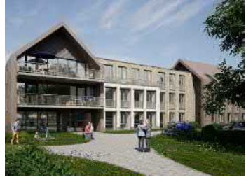
't Harde - Hokseberg -- Woonzorgcomplex met 70 studio's