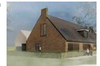
Weversweg – 10 rug-aan-rug + 4 LLB woningen