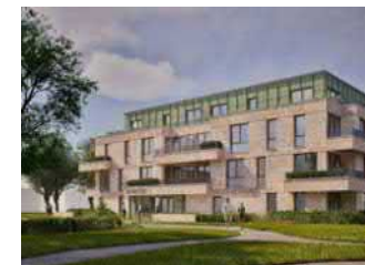
Piersonstraat – 24 app.