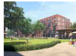
Van Marleplantsoen – 50 app.