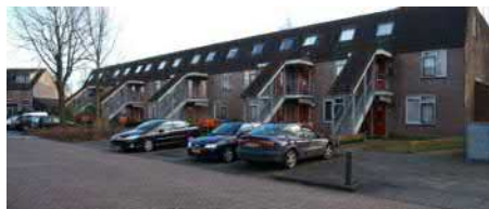
Krommekamp eo, 83 woningen verduurzamen