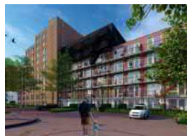
Waterfront, Kade 10 – 44 studio's + 60 2-kamerapp.