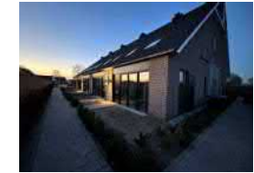
Zuiderzeestraatweg-- 10 rug-aan-rug-woningen