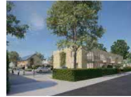
Spronksweg-Hollanderstraat 52 app + 10 egw