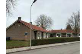
Onderzoek sloop-nieuwbouw Anjer- en Tulpstraat – van 7 woningen naar 19 app