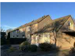
Wezenkamp 15 egw en 8 seniorenwoningen verduurzamen