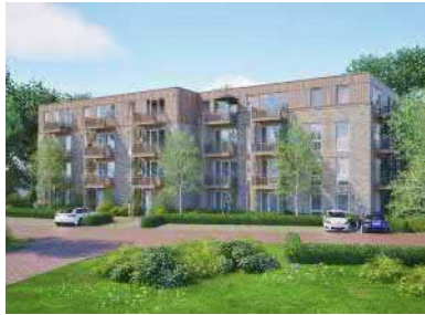
't Harde – 't Hoogh 22 app -- in voorbereiding