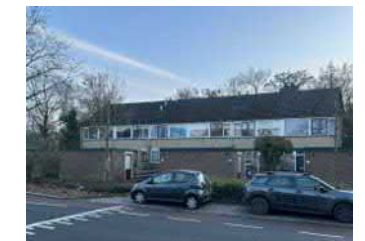
Nijverheidsweg 32 egw - verduurzamen