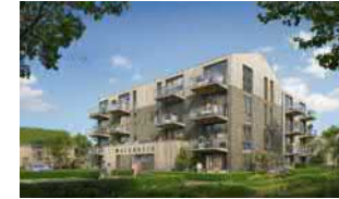
Oldebroek-West III Waterrijk -- 29 app + 10 egw