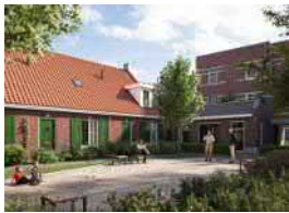
Waterfront, Ons Stadsgezicht - 10 LLB woningen